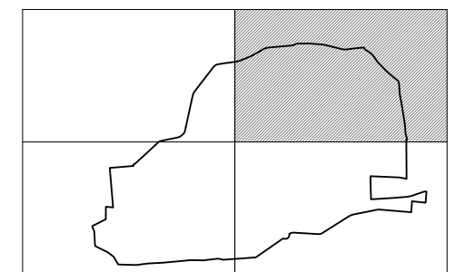
GRAFICO DE DISTRIBUCIÓN DE HOJAS